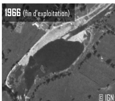
1966 (fin d'exploitation)